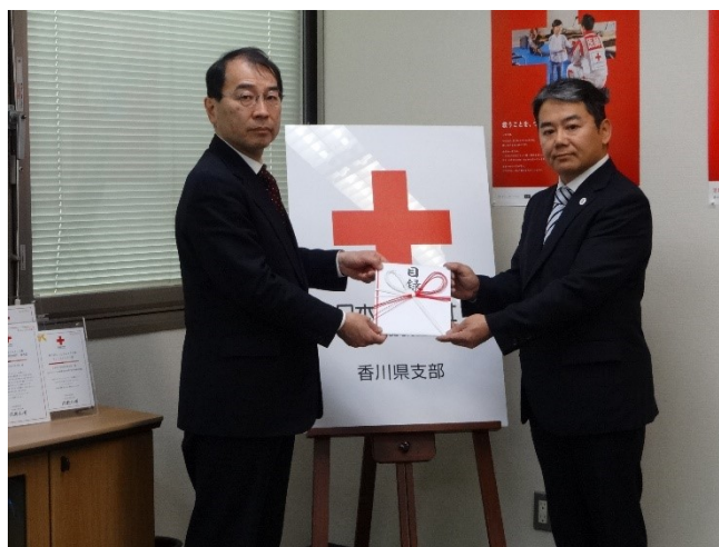
高松市 PTA 連絡協議会